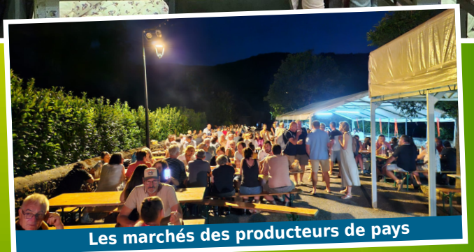
Les marchés des producteurs de pays